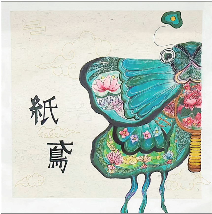
纸鳶 市实小古雷开发区分校 五年(4)班 洪宇珊 (指导老师:卢敏婷)