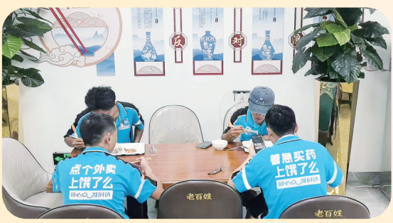
外卖小哥正在暖“新”社区食堂用餐