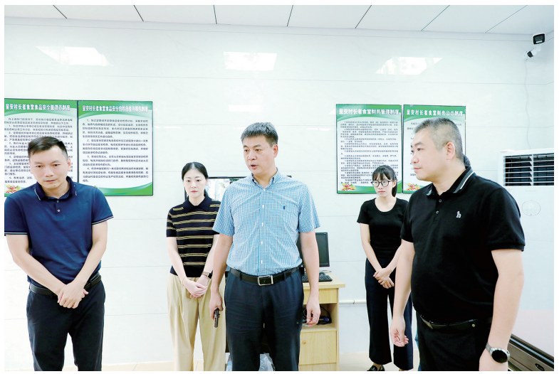
6月17日,云霄县委书记沈顺来带队到呈安村长者食堂调研。

本报讯 6月17日,云霄县委书记沈顺来带队调研农村幸福院建设工作,强调要深入学习贯彻习近平总书记关于民政工作的重要论述,牢固树立以人民为中心的发展思想,想群众之所想、急群众之所急、解群众之所困,扎实推进农村幸福院建设运营工作,真正把好事办好、实事办实。