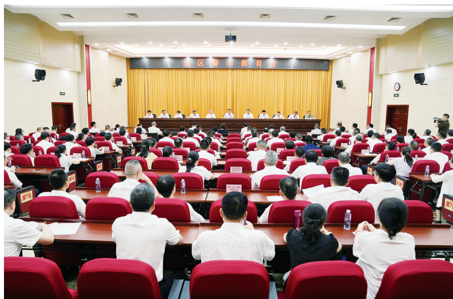
6月18日,龙文区警示教育会召开。区委书记林晓强主持并讲话,区长洪维椿、区人大常委会主任黄泽奇出席会议。